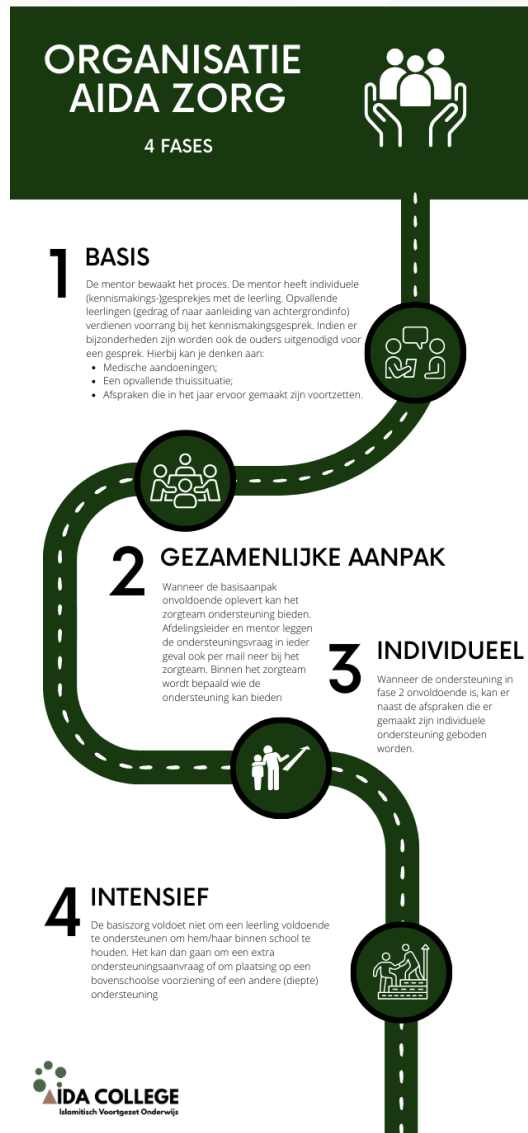
Figuur 3 Onze route naar zorg op maat op het AIDA College